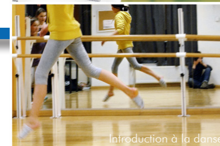
Introduction à la danse