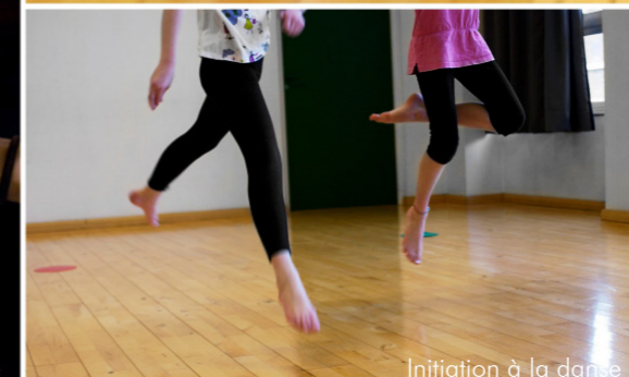
Initiation à la danse